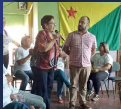
21 de setembro Apae Acre e Apae Rio Branco