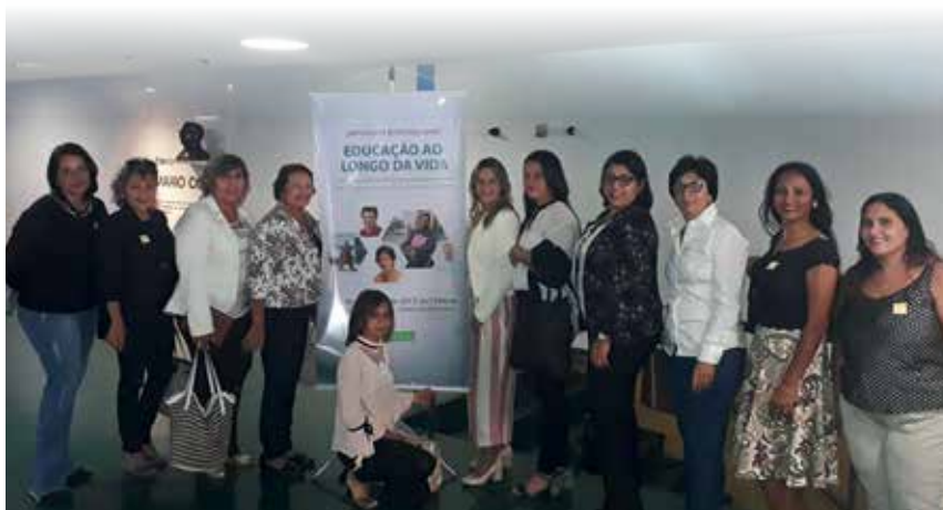
A coordenadora nacional de Educação e Ação pedagógica da Fenapaes e as coordenadoras estaduais participam de audiência pública na Câmara dos Deputados.