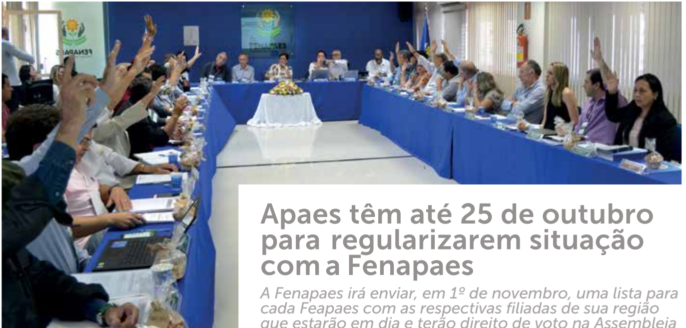
Conselho de Administração e Diretoria Executiva durante votação das matérias em pauta.