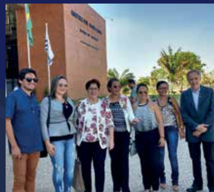
18 de setembro - Feapaes-TO