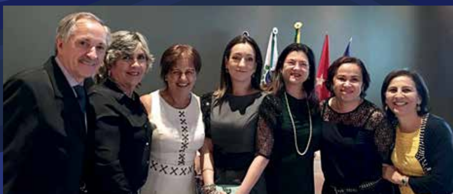
21 de setembro - Feapaes-PR