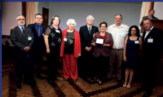
25 de Agosto - Apae Porto Alegre